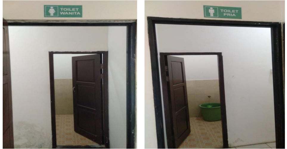
TOILET INTERNAL DINAS PERKIM